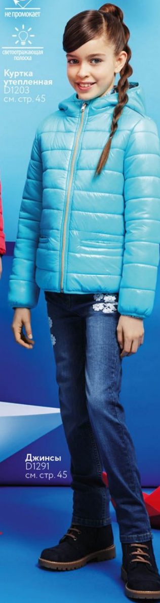
Джинсы D1291 см. стр. 45