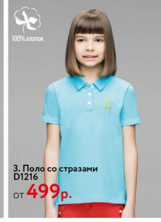
3. Поло со стразами D1216 от 499 р.