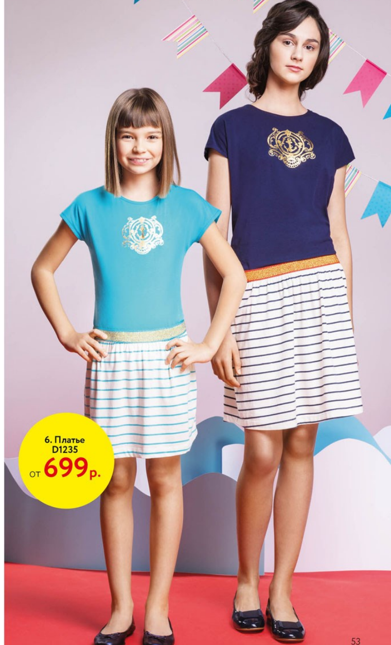
6. Платье D1235 от 699 р.