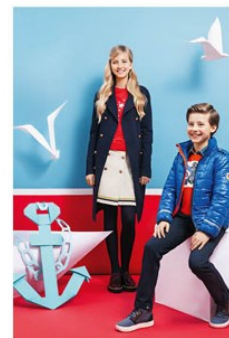
C. 24 MARINE