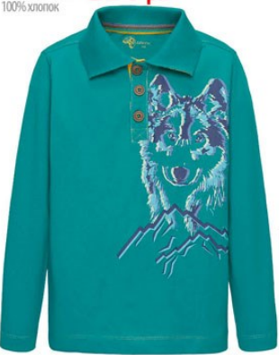
5. Поло М1324 100% хлопок от 599р.