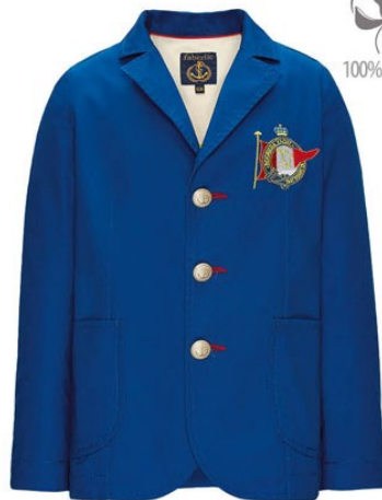
7. Блейзер M0106 1499 р.