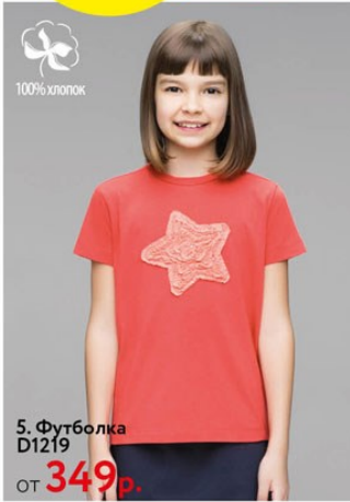
5. Футболка D1219 от 349 р.