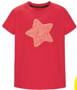
1. Футболка D1219 ОТ 349р.