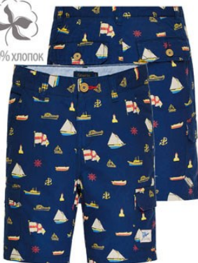
6. Шорты M0160 от 899 р.