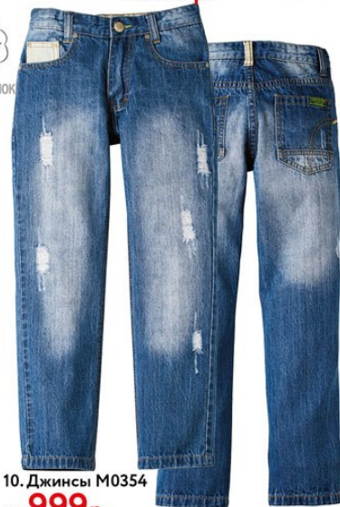
10. Джинсы M0354 от 999 р.