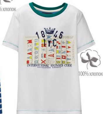
3. Футболка M0135 449 р.