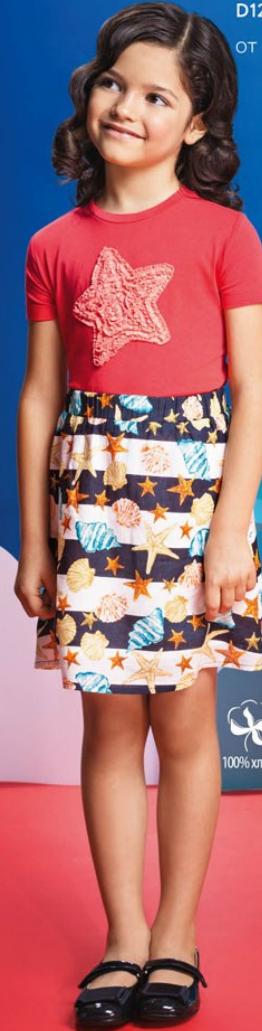
1. Футболка D1219 ОТ 349р.