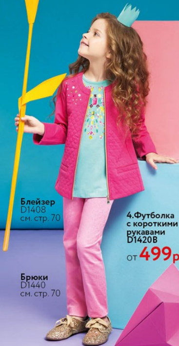
Блейзер D1408 см. стр. 70