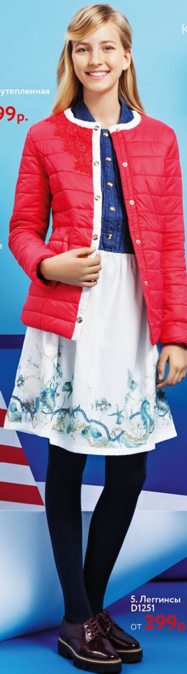
Куртка утепленная D1203 см. стр. 45