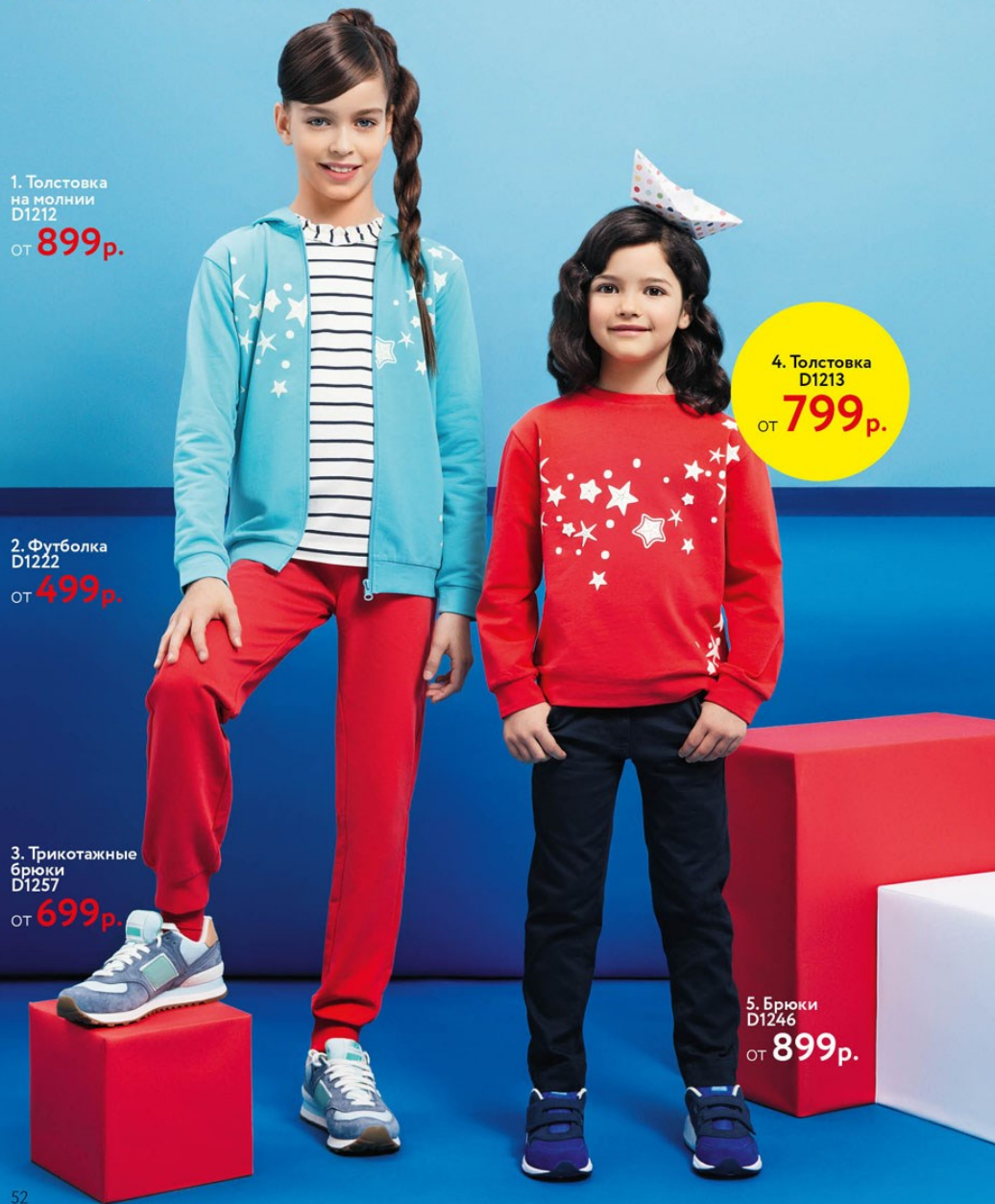
1. Толстовка на молнии D1212 от 899 р.