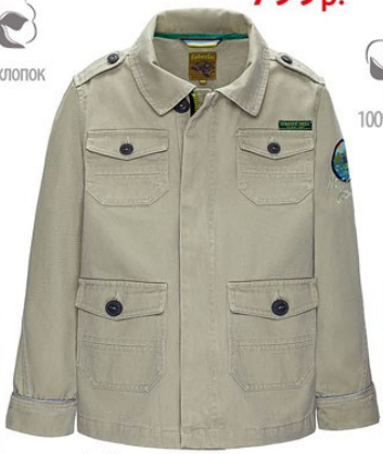
5. Куртка M0301 1899 р.