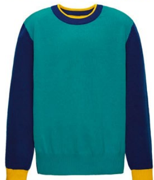
2. Джемпер М1312 100% хлопок от 899р.