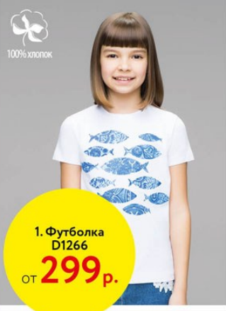
1. Футболка D1266 от 299 р.