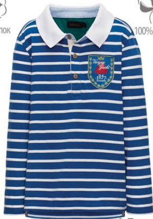
2. Поло M0130 799 р.