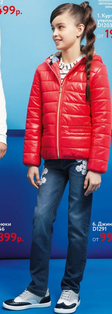
6. Джинсы D1291 от 999 р.