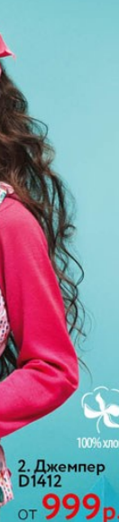
2. Джемпер D1412 от 999 р.