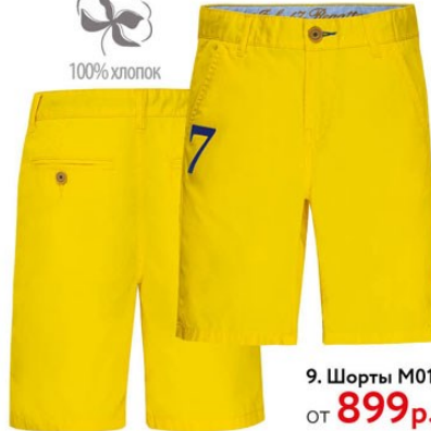
9. Шорты M0158 от 899 р.