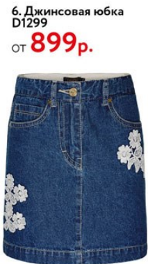
6. Джинсовая юбка D1299 ОТ 899 р.