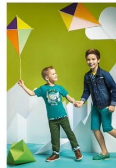
C. 4 AVVENTURA