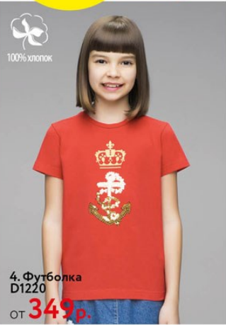
4. Футболка D1220 от 349 р.