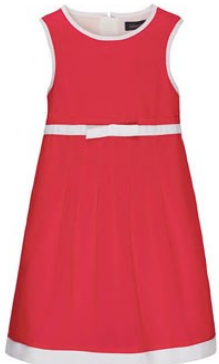
5. Платье D1221 ОТ 1299р.