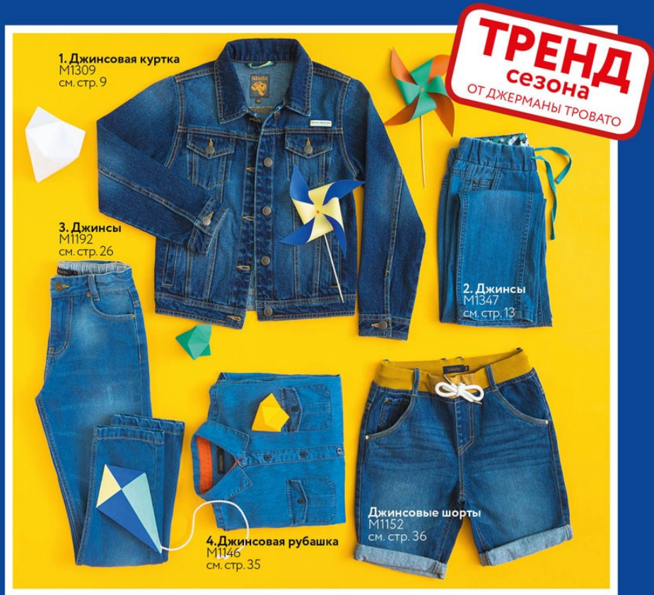
1. Джинсовая куртка M1309 см. стр. 9