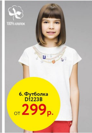
6. Футболка D1223B от 299 р.

1. ФУТБОЛКА D1266 Нарядная футболка прямого силуэта с принтом в морском стиле. Кнопки в плечевом шве для размеров 92-110. 95% хлопок, 5% эластан. Цвет: белый. Размеры: 92-116: 299 р. 122-146: 449 р. 152-170: 599 р.