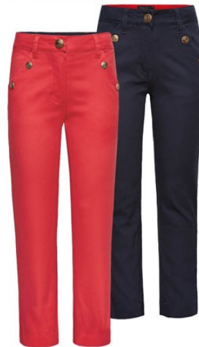
5. Брюки D1246 от 899 р.