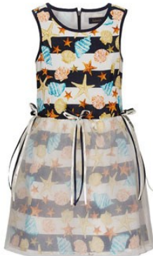
6. Платье D1234 ОТ 1399р.