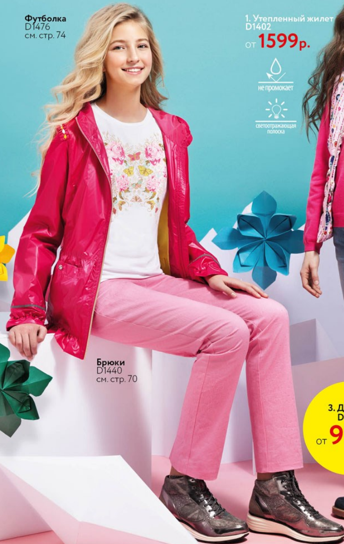
Брюки D1440 см. стр. 70