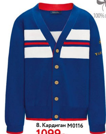
8. Кардиган M0116 1099 р.