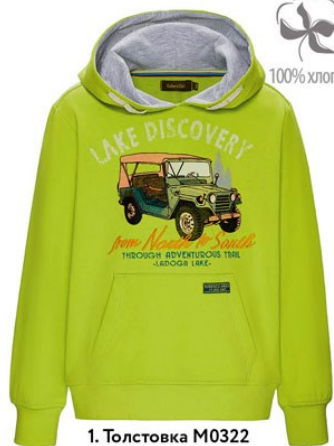
1. Толстовка M0322 1099 р.