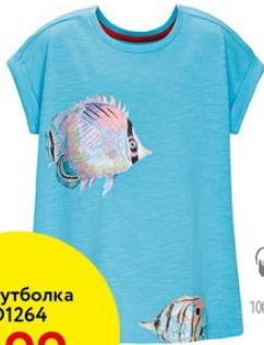
2. Футболка D1264 ОТ 299р.