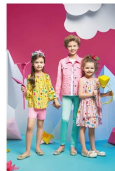
C. 66 ROMANTICA