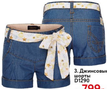
3. Джинсовые шорты D1290 ОТ 799р.