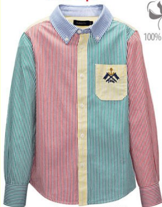
4. Рубашка M0142 от 999 р.