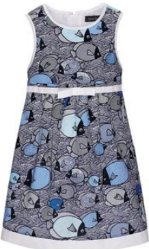
5. Платье D1234 ОТ 1299р.