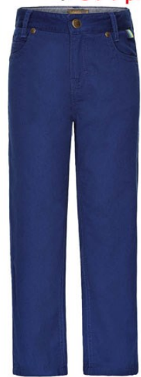
4. Брюки М1342 100% хлопок от 899р.