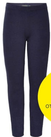
5. Леггинсы D1251 ОТ 399 р.