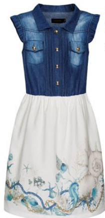
3. Джинсовое платье D1298 ОТ 1499 р.