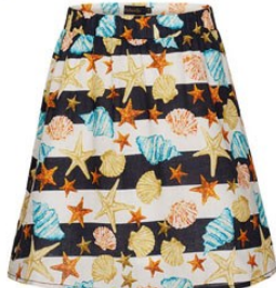
4. Юбка D1236 ОТ 699р.