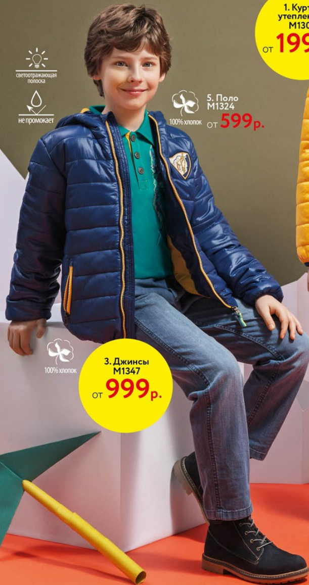
3. Джинсы М1347 от 999р.