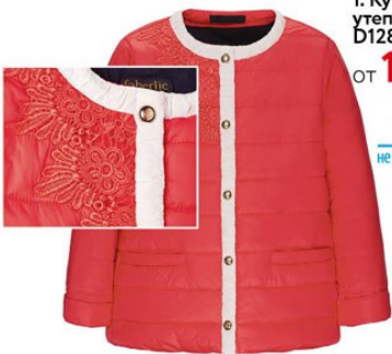
1. Куртка утепленная D1280 ОТ 1999 р. не промокает