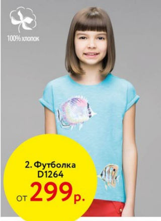
2. Футболка D1264 от 299 р.